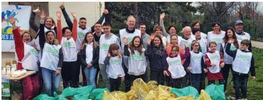
L'opération de nettoyage de nature était proposée par le conseil municipal jeune.

Prévue initialement fin septembre 2021, mais annulée en raison des conditions météorologiques, l'opération de nettoyage de nature proposée par le CMJ (conseil municipal des jeunes) de La Garde-Adhémar, avec le soutien des établissements Leclerc, s'est finalement déroulée dimanche 20 mars. Une cinquantaine de personnes, dont les élus des deux conseils municipaux (adultes et jeunes), se sont livrées à cette tâche, dans la bonne humeur, une bonne partie de la matinée, sur trois sites différents.