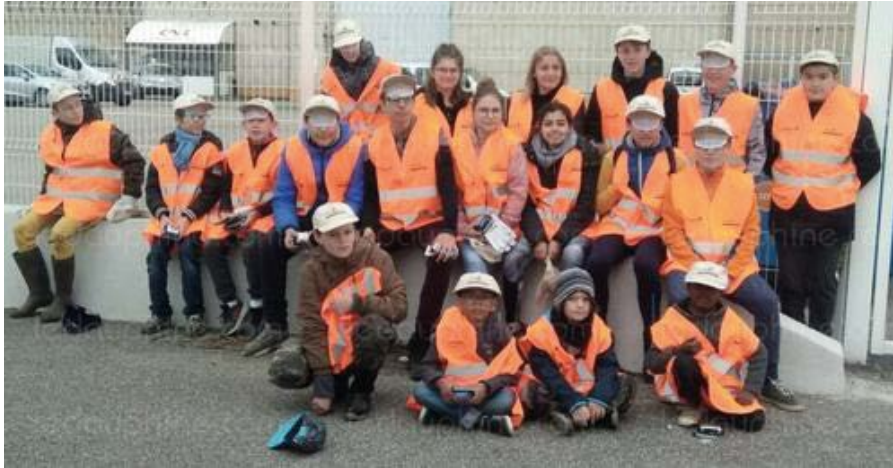
Les jeunes du foyer de Saulce participeront à nouveau à cette action citoyenne.

Depuis plusieurs années, des volontaires participent à l'opération de nettoyage des berges du Rhône organisée par les adhérents de l'Acca de Saulce, Les Turrettes et la Coucourde.