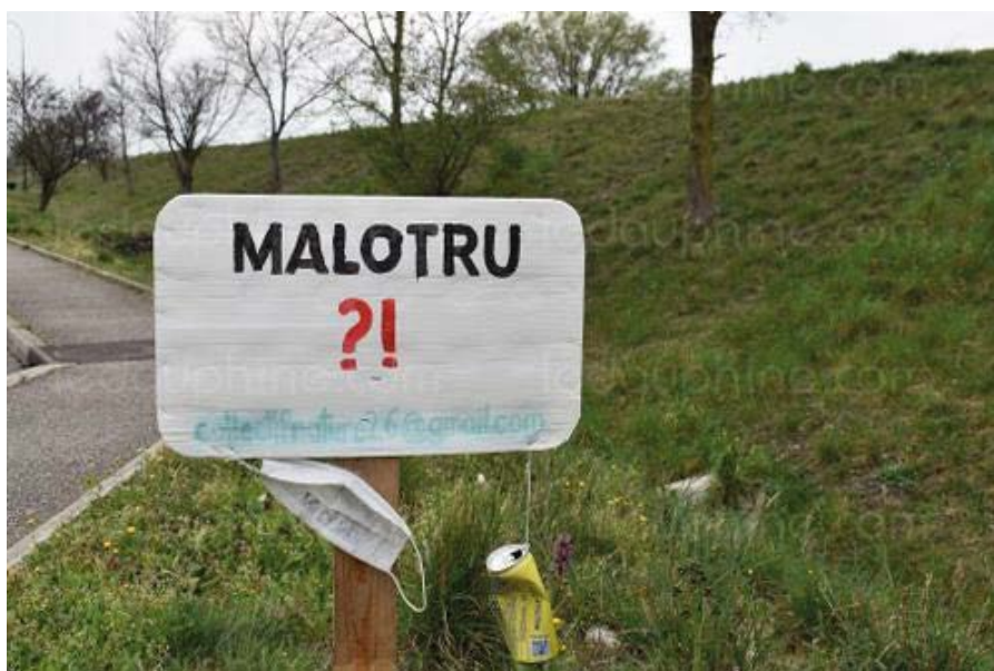
Le collectif n'hésite pas à signaler aux automobilistes qu'une action est en cours.

Le dimanche 27 mars, le collectif s'associera au conseil municipal des jeunes du village de Meysse en Ardèche qui organise une journée de ramassage de déchets dans la commune.