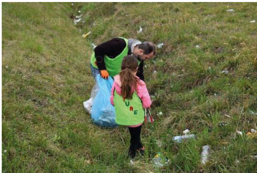
Même les plus jeunes se sentent concernés par le ramassage des déchets.

Chaque dimanche, le collectif nature se réunit à Montélimar pour ramasser les déchets.