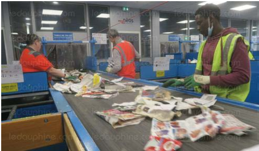
Deux équipes de 12 contrôleurs qualité se succèdent au centre. Leur rôle : affiner sur les tapis roulants le tri réalisé précédemment par des machines.

Le centre Métripolis de Portes-lès-Valence ouvre ses portes mercredi 20 et mardi 26 avril. Réservation obligatoire auprès de Veolia.