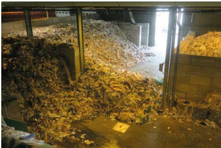
Dans ce hangar, des camions se succèdent afin de déverser les déchets plastiques et cartons par syndicat. En moyenne, cela représente « trois à quatre jours de stock », avant que ce ne soit trié.