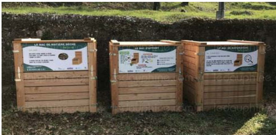
Les bacs à déchets sont à disposition des Castelneuvois.

Dans le cadre de sa politique en faveur du développement durable, la municipalité a souhaité mettre à disposition des bacs à compost pour les élèves de la cantine scolaire et des Castelneuvois.