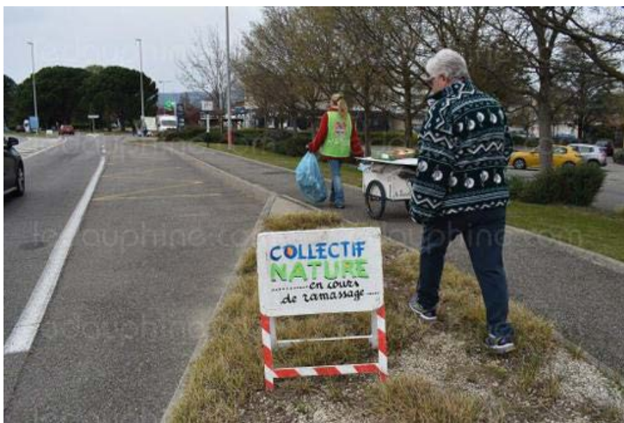
Le collectif n'hésite pas à signaler aux automobilistes qu'une action est en cours.