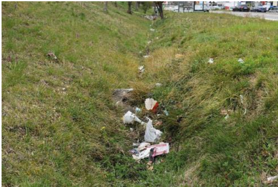
Les fossés au bord de l'avenue étaient particulièrement pollués.