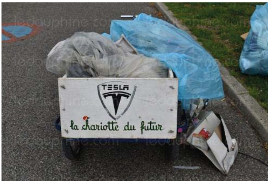
La "chariotte du futur", pour un avenir meilleur ?