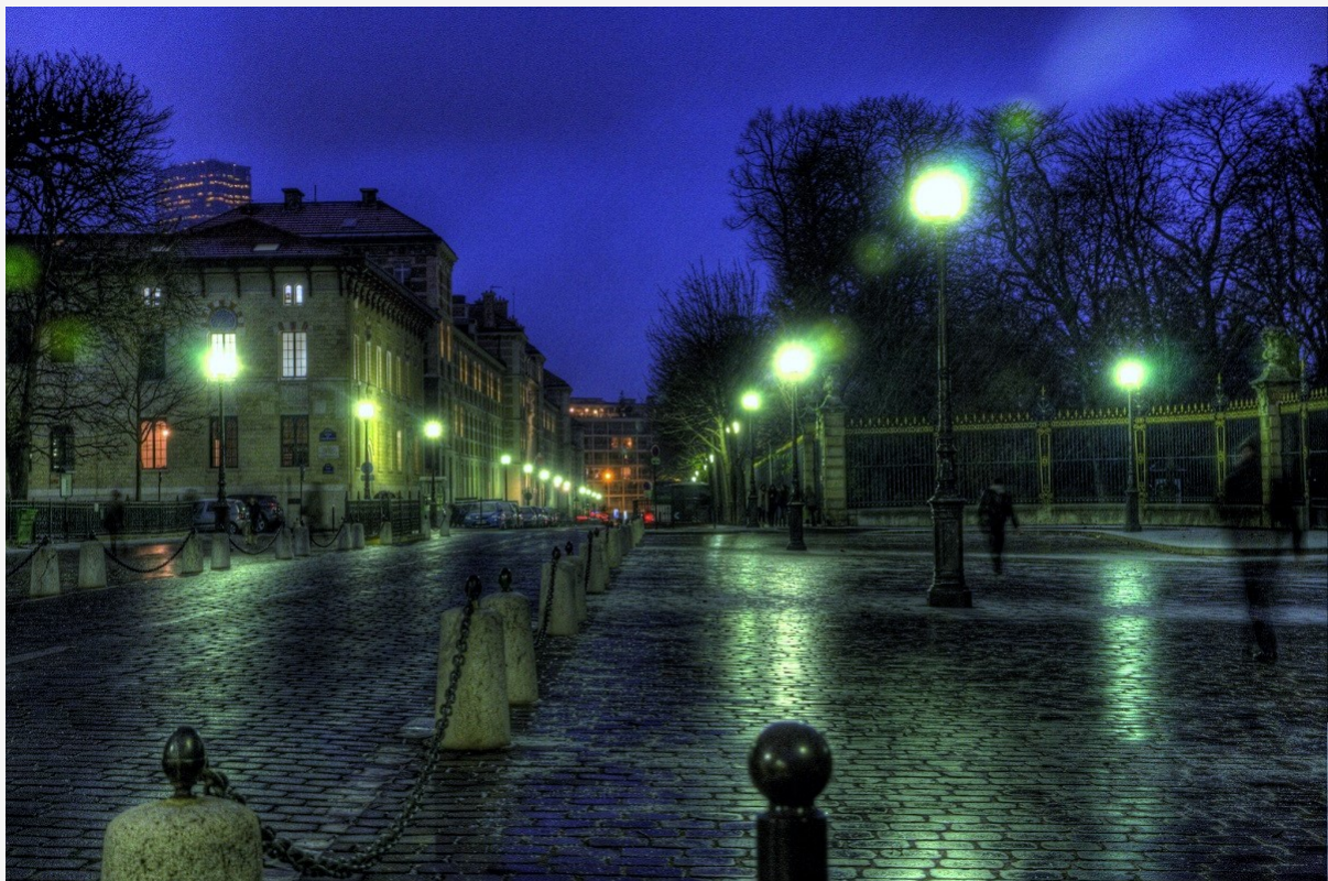
Des rues éclairées, à Paris.

Au-delà de cet enthousiasme conjoncturel pour l'extinction des lampadaires, plusieurs collectivités se sont emparées du problème ces dernières années, rappelle Samuel Challéat. « Depuis la fin du Grenelle de l'environnement, vers 2010, et depuis qu'on peut faire une gestion différenciée de l'éclairage, dans l'espace et le temps, cette question a pris de l'ampleur, a-t-il observé. Cela s'est fait par deux grandes fenêtres politiques : d'une part, celle des économies budgétaires et énergétiques à faire par les collectivités territoriales, et d'autre part, celle de l'érosion de la biodiversité. » Mais le sujet est complexe, en témoigne l'exemple des diodes électroluminescentes : « Les communes qui souhaitent faire des économies d'énergie et budgétaires optent souvent pour des éclairages LED, qui sont une catastrophe écologique car ils diffusent une lumière très blanche avec une couleur bleue qui affectent énormément la biodiversité », détaille Elliot Shaw, chargé d'étude pollution lumineuse à France Nature Environnement Midi-Pyrénées [4].